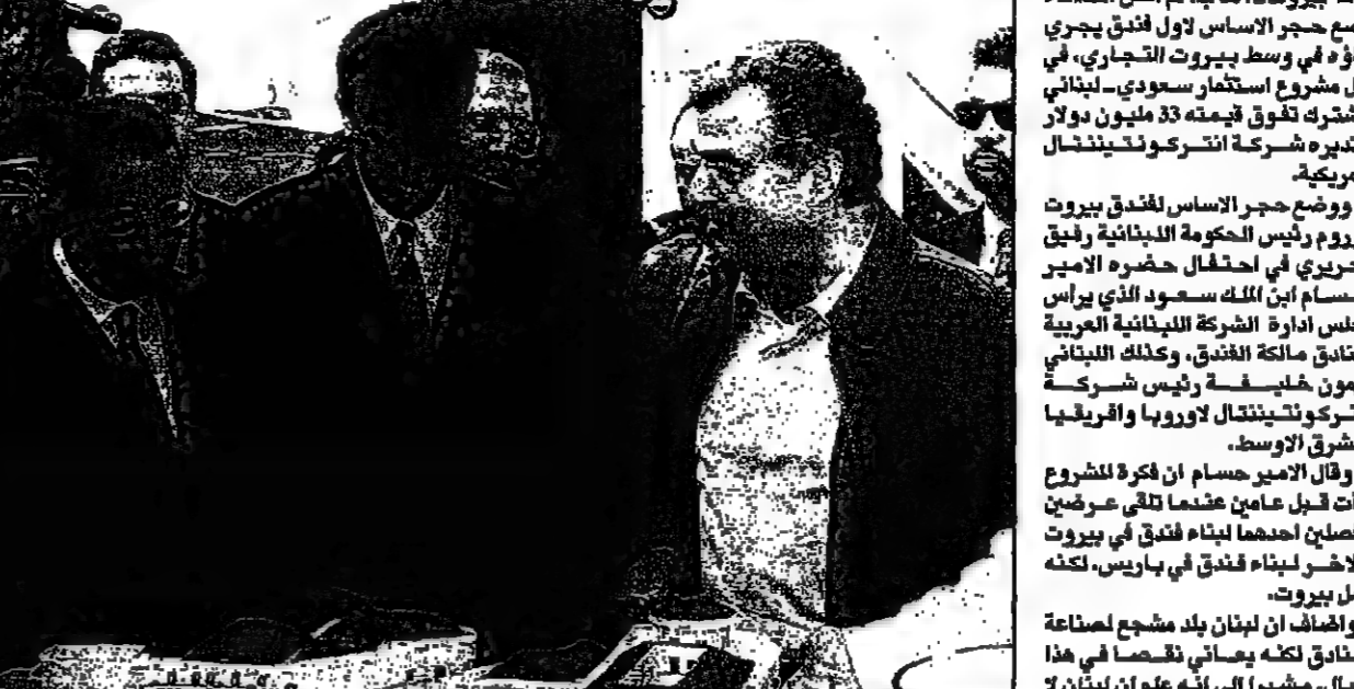
الحريري وابن الملك سعود يضعان حجر الاساس لأول فندق جديد يبنى في وسط بيروت التجاري

بيروت - قال فيد تاسي الخثالا وضع حجر الاساس لأول فندق بحري في وسط بيروت التجاري، في اول مشروع استثمار سعودي لبناني مشتركه لتقوى قيمته 33 مليون دولار وتديره شركة انتركونتيننتال الامريكية.